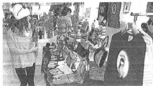
Uno de los puestos del mercado artesanal de mujeres.

Lo hace con una gran variedad de productos que mujeres artesanas de toda Asturias anan en el llamado 'Christmas is coming', que este fin de semana acoge el Hotel Asturias (plaza Mayor, 11). La cita, que reúne a cuarenta puestos, está organizada por la Asociación Cultural D'Aky que ha invitado, a su vez, a la entidad Asturias Acoge que trabaja por