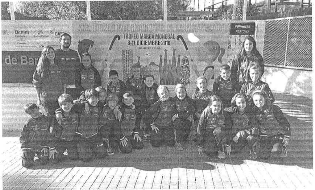
Los equipos alevines del Grupo, junto a sus entrenadores, ante un cartel del torneo.