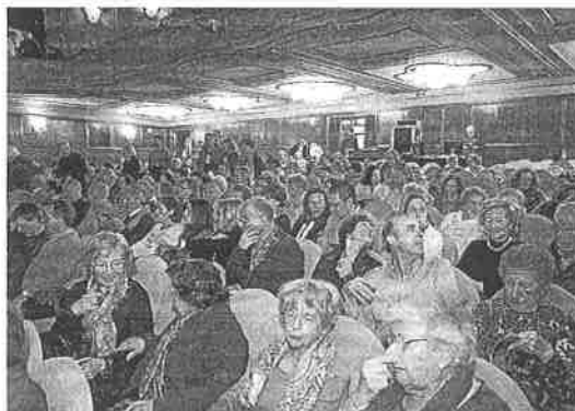
Arriba, la OSPA, durante el concierto en el Jovellanos. Sobre estas líneas, público asistente al recital.

vo en su línea de excelencia. Fallaba el concertino, Alexander Vasilev; su lugar lo ocupó Eva Meliskova. Sobresaliente al coro "El León de Oro"; su papel no era sencillo. Fue original su puesta en escena, moviéndose con relación al texto, simulando discutir o rodeando a la orquesta.