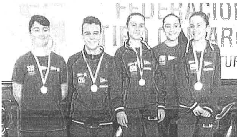
Arqueros del Grupo con sus medallas. | RSCC