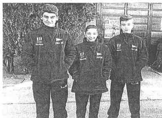
Los tres karatecas del Grupo en la competición nacional.

Al acabar la competición tendrá también lugar la entrega de trofeos a los vencedores del circuito. Recibirán premio las tres primeras nadadoras y los tres primeros nadadores de cada categoría en la clasificación por la suma de puntos FINA de las pruebas nadadas. La primera prueba del circuito fue el Trofeo Amaguestu que se disputó el mes de octubre.