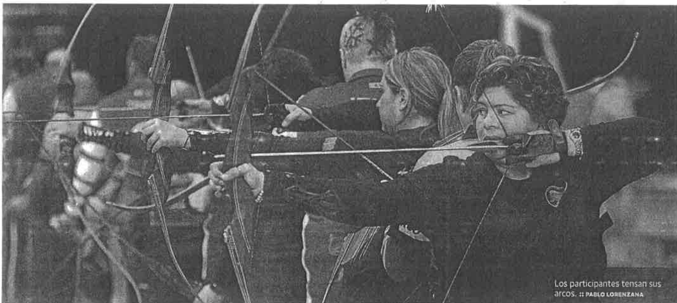
Los participantes tensan sus arcos.