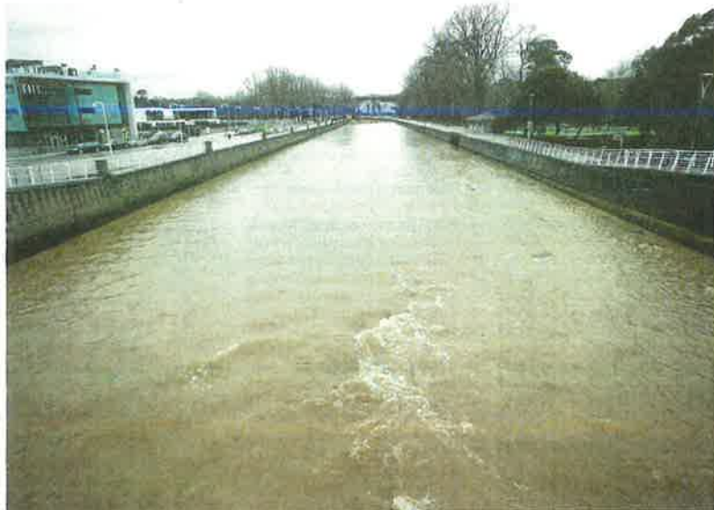
Color marrón ayer del río Piles en una imagen captada desde el puente.