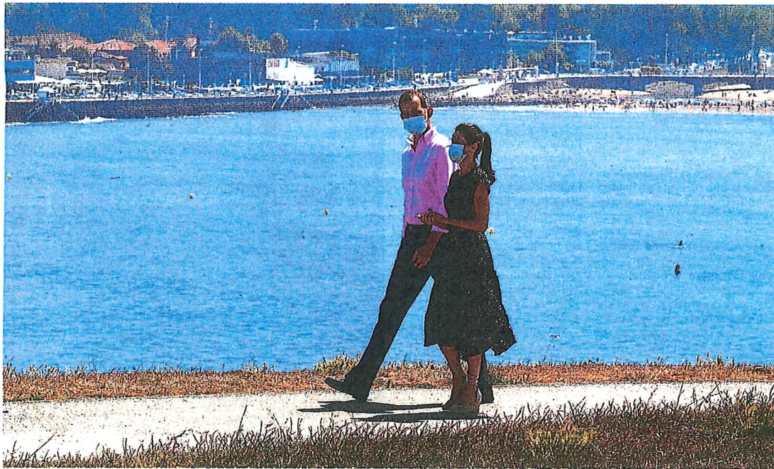
Don Felipe y doña Letizia pasean por el cerro de Santa Catalina.