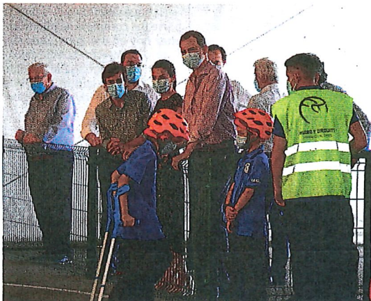
Don Felipe y doña Letizia con Fernando Alonso.