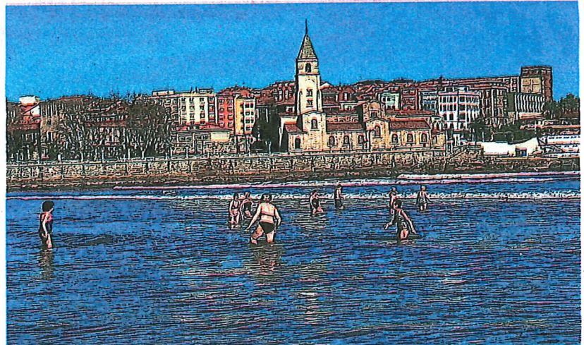
Bañistas a media mañana frente a La Escalerona, en la playa de San Lorenzo. CAROLINA SANTOS

Una opinión que en esa misma terraza compartió un hostelero