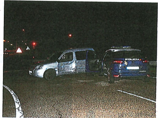
Los coches siniestrados, a las diez de la noche, en la raqueta de la AS-II que permite incorporarse a la ronda o cambiar de sentido. PALOMA UCHA

Patronato Deportivo Municipal (PDM) serán consultadas para incluir en el proyecto las características del cauce necesarias para la práctica del piragüismo, mientras que de la renaturalización se encargarán la Universidad Politécnica de Madrid y la empresa adjudicataria.