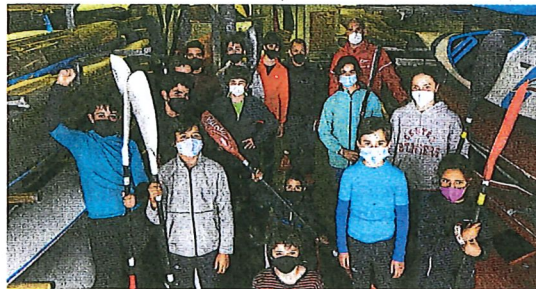
Grupistas se disponen a coger las piraguas en la entidad deportiva.

desplazamientos a Trasona, que tantos «trastornos» ocasiona a las familias de los palistas.