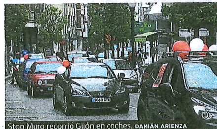
Stop Muro recorrió Gijón en coches. DAMIAN ARIENZA