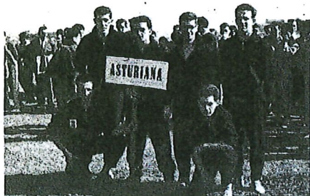
Carpeta, abajo a la derecha, con la Selección Asturiana en un nacional de campo a través.