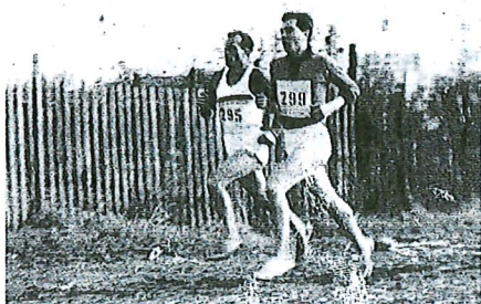
El gijonés, (dorsal 295) durante un cross en Francia en Borgoin Jallieu, en 1966. A. R. C.