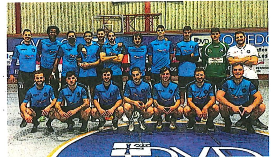
Equipo masculino del Unión Financiera Base Oviedo. E. C.

E. C. La Junta Rectora del Patronato Deportivo Municipal, reunida ayer de forma telemática, aprobó la formalización de los convenios de colaboración con 16 entidades de Gijón, con una cuantía de 332.000 euros. Entre los clubes beneficiados destacan el Solimar, Gijón Mariners, Grupo Covadonga, Santa Olaya, Balonmano Gijón, Fodeba, Gijón Playas, La Calzada, Ceares, Finetwork, Universidad, Gijón Atletismo, Gijón Industrial, Gijón Basket, Círculo y Terapias Ecuéstras.