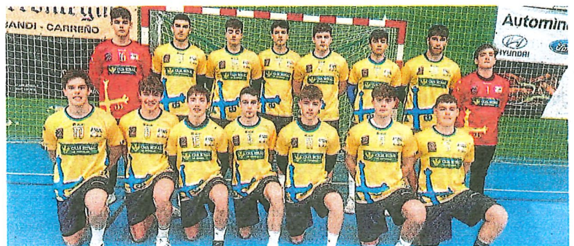
Equipo juvenil masculino que compitió en los nacionales.