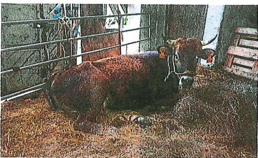
'Lucera' mantendrá reposo absoluto durante las próximas 48 horas.