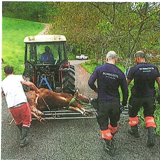
Momento del traslado de 'Lucera' a su establo tras el rescate.